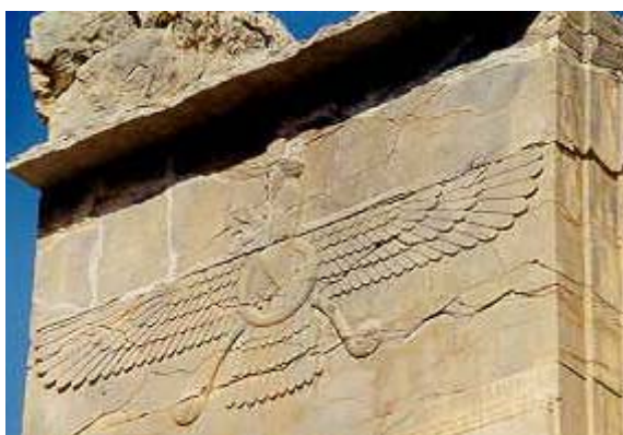
Persepolis (Zeichen des Religionsgründers Zarathustra)

Lange vor islamischer Zeitrechnung hatte in Mekka ein Komet eingeschlagen. Dort errichteten die Menschen viele kleine Götzentempel und später die Kaaba, welche nach der Islamisierung zum größten Heiligtum der Moslems wurde. Arabische Beduinen brachten den Islam nach Persien. Sie stießen auf wenig Gegenwehr. Im Gegenteil: Das unterdrückte Volk jubelte ihnen zu, denn längst hatte die Staatsreligion Zarathustras mit einer bigotten korrupten Priesterschaft den Rückhalt bei den Gläubigen verloren. Massenhaft trat die Bevölkerung zum Islam über. Die ersten Moscheen entstanden auf den Ruinen der damaligen Feuertempel. Schon 30 Jahre nach Mohammeds erster Predigt beteten die Perser Richtung Osten nach Mekka.