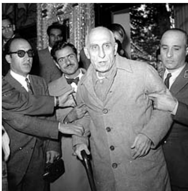
Mossadegh bei seiner Festnahme

ander und sein Ziel war es, das im Iran zu verwirklichen. Er wurde aber durch die Diktatur Reza Schahs lange Jahre gebremst. Nach dessen Sturz und durch seinen unermüdlichen Kampf gegen jede Art der Diktatur wurde er als Abgeordneter ins Parlament gewählt. Die wichtigste Aufgabe des neuerwählten Parlaments war das Gesetz zur Nationalisierung der Ölindustrie, das im März 1951 unter dem Jubel der Bevölkerung verabschiedet wurde. Den größten Anteil daran trug Mossadegh. Er wurde mit absoluter Mehrheit vom Parlament zum Premierminister gewählt und genoss in der Bevölkerung ein ungeheures Maß an Beliebtheit und Vertrauen. Daraufhin versuchten die Engländer durch einen militärischen Gegenschlag die alte Situation wieder herzustellen. Es war die größte Marinekonzentration im Mittelmeer seit dem 2. Weltkrieg. Mossadegh aber wandte sich an den Gerichtshof in Den Haag und erhielt Recht. Doch die Briten gaben den Kampf um Iran nicht auf. Durch Verschärfung von Boykottmaßnahmen und Intrigen sowie Unterstützung des CIA bereiteten sie den Sturz Mossadeghs vor.