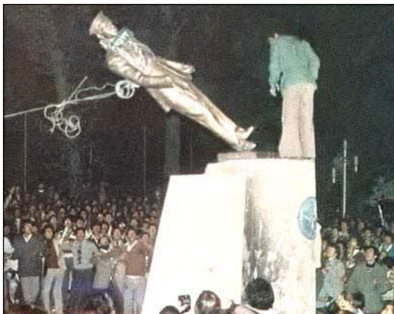
Studenten stürzen in Teheran im Nov. ,78 die Statue des Schahs

ten Putsch gegen die Regierung Mossadeghs an die Macht gekommen war. Es war nicht zuletzt der Widerstand gegen die Amerikaner, der das iranische Volk 1978 auf die Straßen trieb. Am 16. Januar 1979 war es endlich so weit: Der Schah verließ – nachdem er vorsorglich den ihm gewogenen Bahktiar als Vertreter eingesetzt hatte – fluchtartig das Land. Hegte er die Hoffnung, vielleicht wieder nach Iran zurückkehren zu können, so zerplatzte diese wie eine Seifenblase. Denn die Armee, die stärkste im Nahen Osten, fiel wie ein Kartenhaus zusammen und mit ihr der Polizeiapparat und der Geheimdienst. Bahktiar selbst regierte das Land nur einige Wochen.