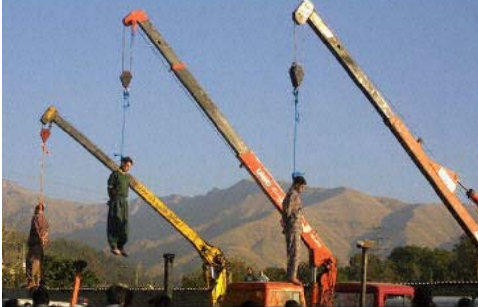
Hinrichtungen im Iran (an Kränen wurden Todeskandidaten mitunter ohne Verhandlung aufgehängt)

Innerhalb weniger Monate wurden Gegeneinrichtungen zu den bestehenden gesellschaftlichen Institutionen gebildet. So entstand neben der Armee die Organisation der Pasdaran (Wächter der Revolution) ; die Aufgabe der Polizei übernahmen sogenannte Revolutionskomitees . Der gesamte Justizapparat wurde durch die Errichtung islamischer Revolutionsgerichte lahm gelegt. In allen Behörden und Ämtern übernahmen die Mullahs die Kontrolle. In jedem Ministerium, jeder Fabrik, an Schulen und Universitäten wurden „ Islamische Räte “ gebildet, die Säuberungen durchführten und ihre Widersacher, ob Schahanhänger, Linke oder Nationalisten, hinauswarfen. Khomeini gab weiterhin bekannt, dass der Islamische Staat dazu berufen sei, das System der welayate faghieh (d. i. Herrschaft der Geistlichkeit) zu errichten, also auch das Privatleben der Menschen zu kontrollieren. Der Islamische Staat empfangen seine Anweisungen direkt von Gott und ein Ausscheren oder Zuwiderhandeln sei Frevel und werde schwer bestraft.