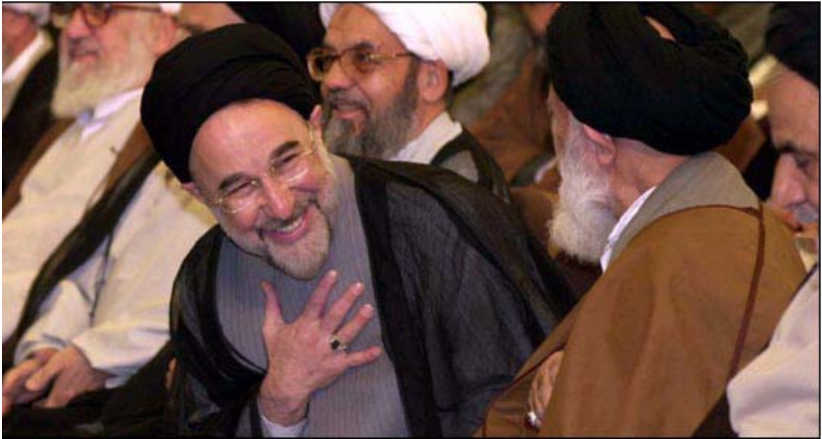
Khatami in der Madjlis

„Wir werden Dich beschützen Khatami! Wir stehen auf Deiner Seite!“ hört man laut rufen – und dies gilt unverblümt den Konservativen.