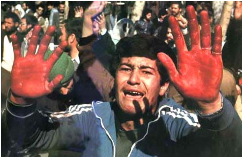
Islamische Revolution Ein Demonstrant hält verzweifelt seine blutgefärbten Hände in die Höhe

Vorreiter dieser Massen waren die Slumbewohner , die die eigentliche Basis der fundamentalistischen Mullahs im Iran darstellten. Sie besaßen alle Voraussetzungen und Eigenschaften, die dieses System zum Durchsetzen seiner Ziele benötigte. Diese Menschen waren entwurzelt, brutal, unwissend und ungebildet. Sie waren gezwungen, ein „Lumpendasein“ zu führen und hatten den „Bauch mit Wut gefüllt“. Diesen Menschen gab Khomeini „grünes Licht“, und sie gehorchten ihm blindlings, denn plötzlich wuchs ihr Selbstwertgefühl ins Unermessliche. Sie konnten keine Gnade, hatten sie selbst doch nie Gnade genossen.